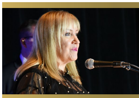
La présidente du conseil d'administration

Nous tenons à souligner et remercier tout particulièrement les membres du jury. Vous avez accepté d'investir de votre temps et de faire preuve d'une rigueur et d'un engagement exemplaires dans votre rôle. Nous vous saluons et vous remercions du fond du cœur pour votre contribution inestimable à cette soirée.