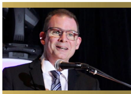
Le président-directeur général